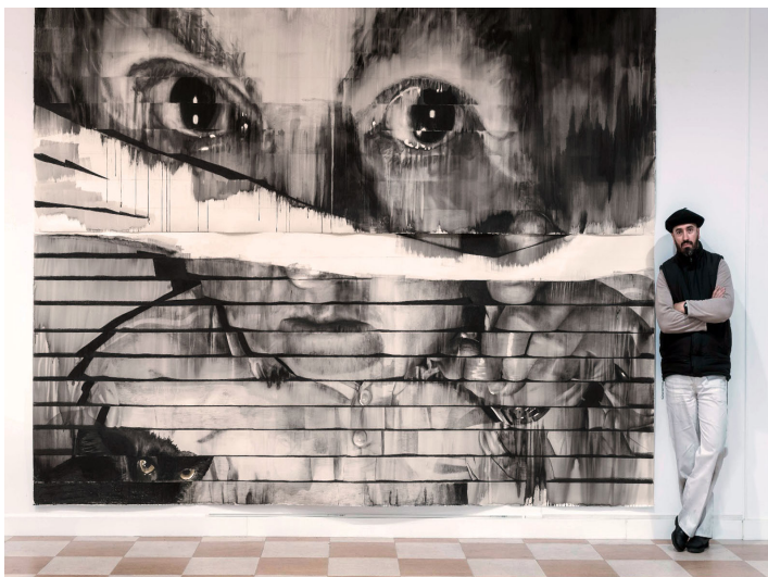
Obra en el estudio antes de ser cortada y preparada para colocarla en el Centre Pompidou Málaga