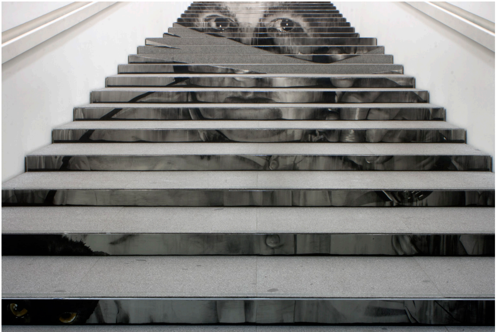
La obra 'Papá' instalada en un "no lugar" las escaleras de acceso a la Colección Permanente del Centre Pompidou Málaga

La tesis de Augé de considerar lo social como un territorio de relaciones espaciales, lo acerca a la teoría de la arquitectura y la ciudad cuyo objeto se funde con el de la antropología y que, sin duda, ha tenido gran influencia sobre al discurso "más débil" de la práctica artística. Su discurso sobre la "sobremodernidad" funciona y se disemina en circuitos que ya no son estrictamente los de las ciencias sociales, sino que forman parte del trasiego de ideas que fluyen y se desplazan de disciplina a disciplina y de saber a saber, trascendiendo fronteras culturales e intelectuales, e impulsadas por fuerzas diversas y que constituyen el tool kit básico del comentarista de la sociedad contemporánea. Al arte aplica la mirada genuina del antropólogo francés identificando espacios, agentes, objetos y, sobre todo, las relaciones específicas que se establecen entre ellos. Su impacto más profundo lo encontramos en la teoría y la práctica artística francesa y un ejemplo de ellos es el "arte contextual" propuesto por Pierre Ardenne 2 . Este artista comparte con Augé la reivindicación de lo real, que entiende como red de relaciones, y de la ciudad como objeto fundamental de investigación y práctica artística. Sin embargo, esta llamada al realismo confina la intervención al ámbito de lo micropolítico, es decir, al campo artístico entendido en sentido estricto. Los "no-lugares" serían aquellos espacios