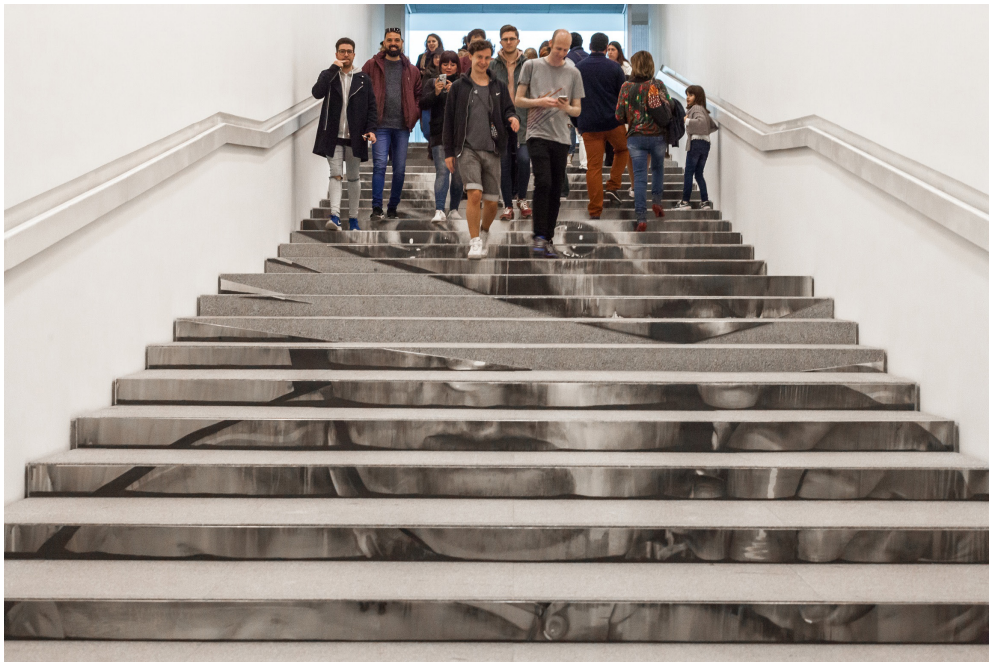
La escalera de acceso del Centre Pompidou Málaga convertido en un lugar con alma ya que cada persona vivió su propia vivencia personal, al bajar la escalinata y encontrarse con la intervención artística