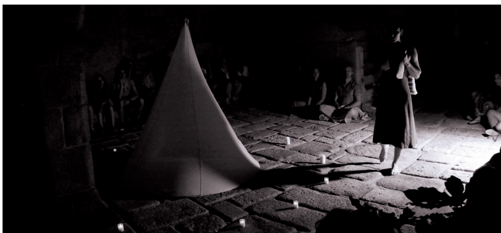
Performance Cura de Coração . Portugal, 2014.

Al finalizar la proyección salgo muy cuidadosamente de este espacio y realizo unos movimientos de respiración: aire que al inhalarlo me purifica, y que exhalado me permite vaciarme de lo que me contamina; movimientos de brazos que van del cielo a la tierra para cargarme de energía. A continuación quemo con velas las medias que portaban en su interior las piedras, una ruptura simbólica de cadenas, y me libero de lo que me pesa.